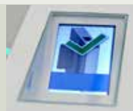
Intégration d'appel ascenseur