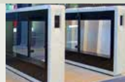
Customisation sur demande