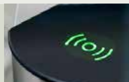
Picto d'état + Intégration du lecteur de badge