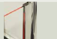
Lumière sur vantail + Charnière pleine