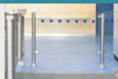
Mains courantes - Guides