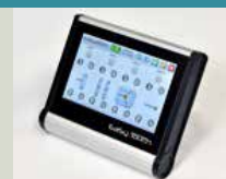
Pupitre de Commande déportée